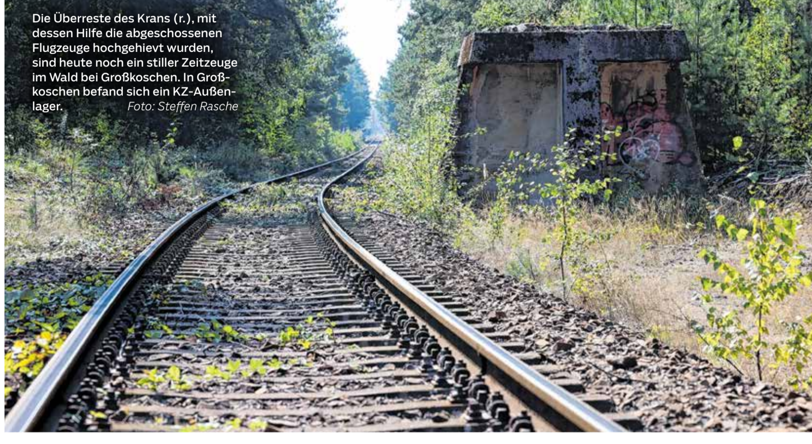
Die Überreste des Krans (r.), mit dessen Hilfe die abgeschossenen Flugzeuge hochgehievt wurden, sind heute noch ein stiller Zeitzeuge im Wald bei Großkoschen. In Großkoschen befand sich ein KZ-Außenlager.

Der Nationalsozialismus traf die Familie jedoch auch ganz konkret. 1941 wurde sein Vater kurz vor Weihnachten von der Gestapo verhaftet. Der Vorwurf: Diebstahl von „Volkseigentum“. Er hatte einem Soldaten für 20 Reichsmark einen Pelzmantel abgekauft, der aus einem zuvor geöffneten, verplombten Güterwagen stammte. Als bei der Gerichtsverhandlung bekannt wurde, dass der Vater Mitglied der