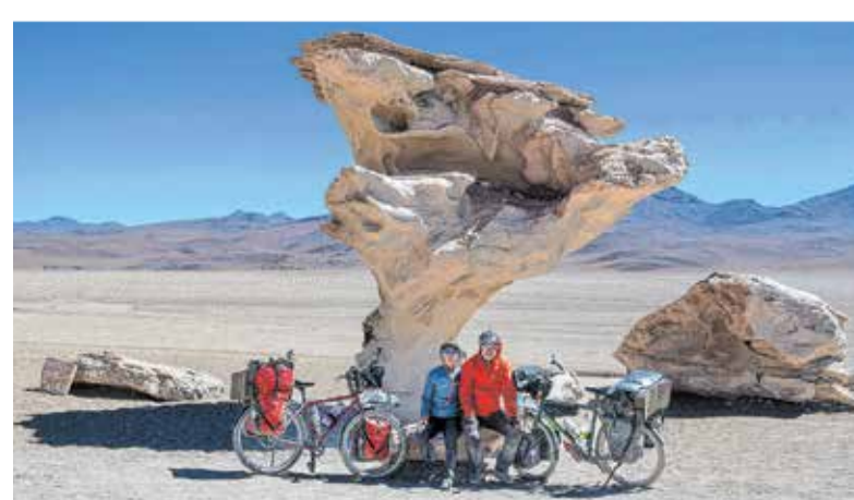
Sandra Butscheike und Steffen Mender am Arbol de Piedra in Bolivien, dem markanten Baum aus vulkanischem Gestein.

Karten gibt es in der Tourist-Information Senftenberg, Markt 1, unter Telefon 03573/14 991 010 sowie an der Abendkasse. Weitere Informationen unter www.outdoorvisionen.de